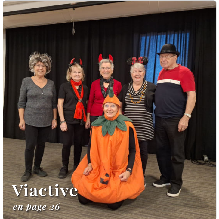
Viactive en page 26