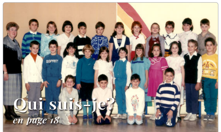
Qui suis-je? en page 18