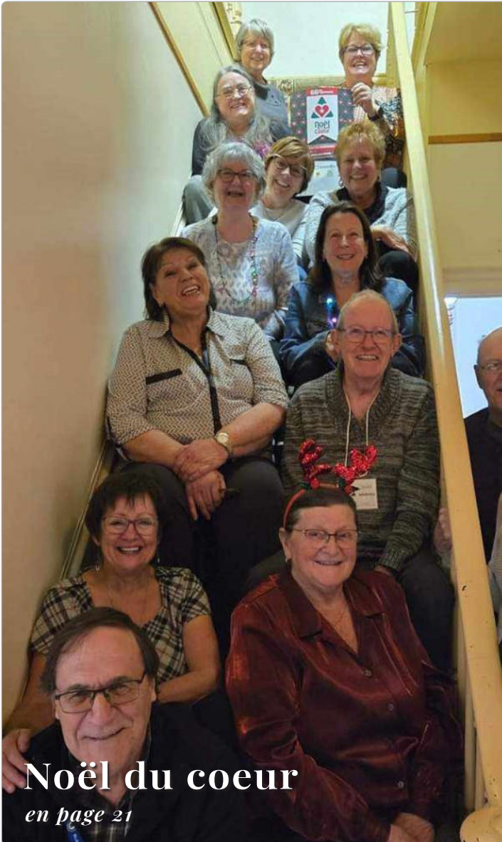
Noël du coeur en page 21

819 299-3858 - info@lestephanois.ca - www.lestephanois.ca